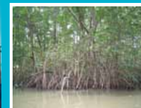
マングローブの森