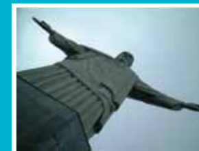
リオのキリスト像

ブラジル生活体験談や日本とブラジルの意外なつながりを、画像や音楽とともにお伝えします。本場のブラジルコーヒーを飲みに来ませんか？