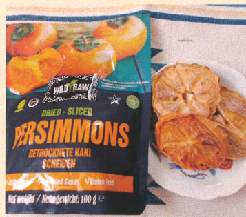
値段420円前後 (消費税込み・輸入品のため変動があります)

果物大国トルコでは、日本原産の富有柿まで栽培されていました。これも一種の里帰りでしょうか。トルコで栽培した富有柿を輪切りにしてドライフルーツにしてあります。