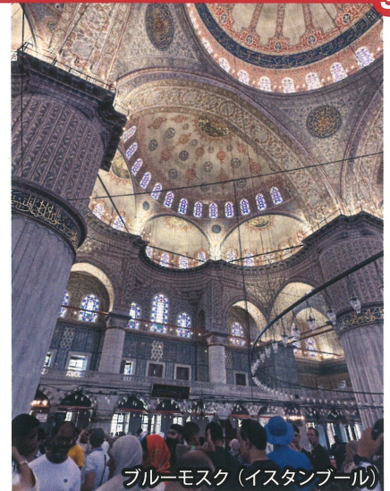
ブルーモスク (イスタンブール)

とても楽しかったトルコ旅行、もっとトルコにいたかったです。次回は夫の生まれ故郷のトラブゾンへ遊びに行くのが目標です。